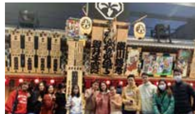
校外学習では「都庁」「大江戸博物館」などへの訪問・見学、レクリエーションデーでは「七夕まつり」「餅つき・書き初め」などを予定しています