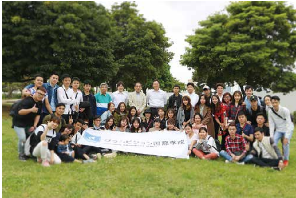
日本の文化に触れたり、仲間との交流を深める多くの行事を用意しています