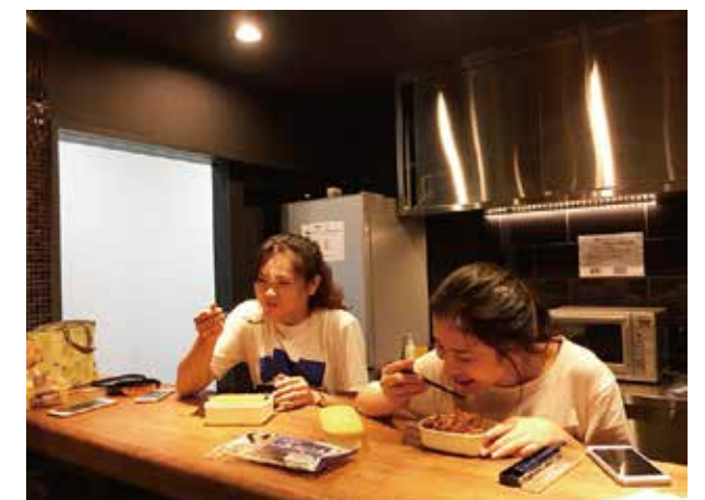
カウンターキッチン