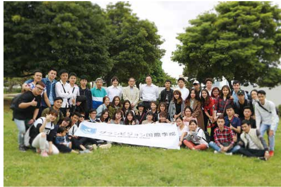
우리는 일본의 문화를 만지고 친구들과의 교류를 심화시키기 위해 많은 행사를 준비했습니다.