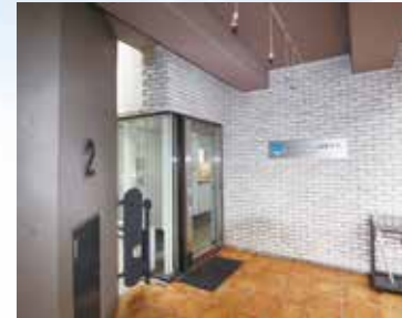
대학 2F 입구