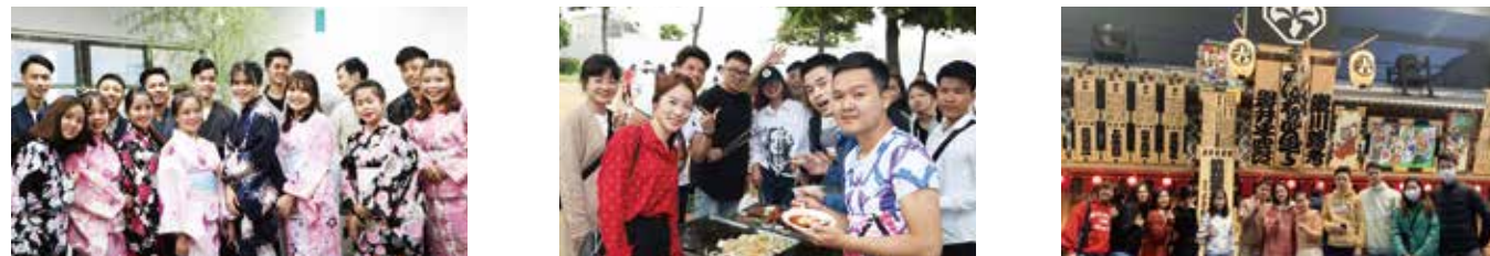
견학에서는 "도쿄 도청", "오에도 박물관"등을 방문하고 방문하십시오. 레크리에이션 일에는 "타나바타 축제"와 "모치츠키 / 글쓰기의 시작"등을 계획하고 있습니다.