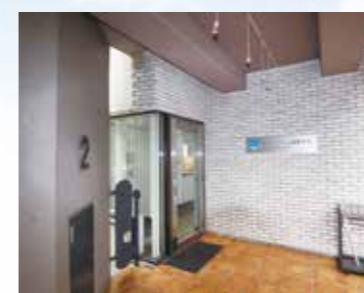
Вход в колледж 2F