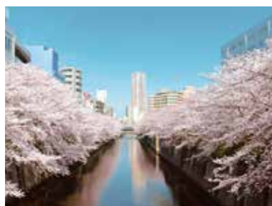
Цветение сакуры на реке Мэгуро

Есть река Мэгуро и парк Сетагая, которые популярны как аттракционы цветущей сакуры, и это среда, где вы можете почувствовать природу, даже если она находится в городе. Есть также много ресторанов и удобных магазинов.