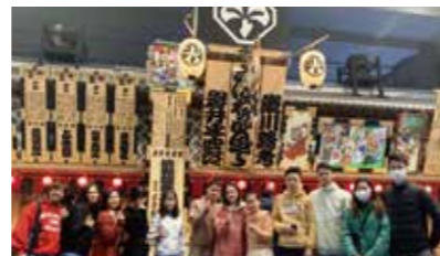
校外教學將至「都廳」「大江戶博物館」等地方參觀訪問。 康樂日則預定舉辦「七夕祭」「搗年糕、書初（新春試筆）」等活動。