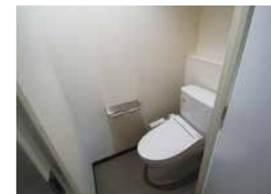
ウォシュレット付きトイレ