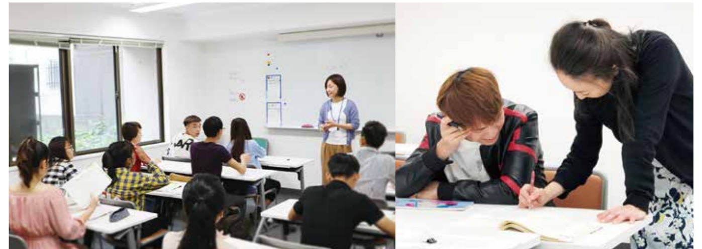
※写真は東京校になります。

本校では、経験のある先生が、初級から中級、上級まで、みなさんの習熟度に応じた授業を行っています。また、クラス担任制ですので、困ったことや、わからないことは、すぐに相談することができますので、安心して授業が受けられます