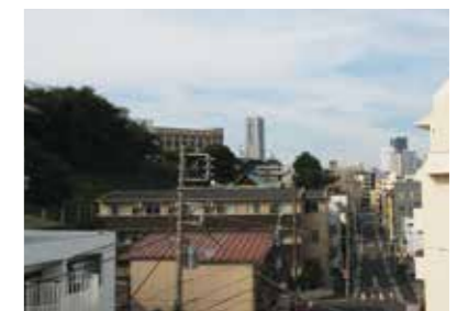
窓から見えるランドマーク