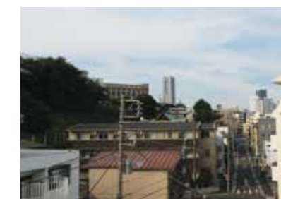
Достопримечательности, видимые из окна