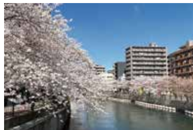
Цветение вишни на реке Оока

Рядом со станцией Коганечо протекает река Оока, известное место наблюдения за цветением сакуры. Он находится недалеко от станции Йокогама и станции Каннай и имеет хороший доступ к Токио. Вокруг станции Каннай расположены общественные учреждения, такие как правительственные учреждения, а вокруг порта Иокогама расположено множество парков, что делает его местом, где вы можете почувствовать природу, даже находясь в городе.