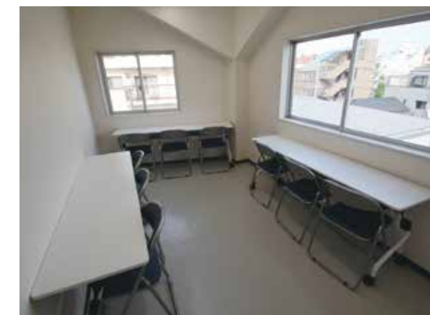
Многоцелевое пространство 3F