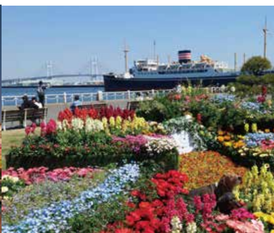
Порт Иокогама/Парк Ямасита