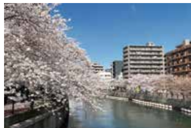
Hoa anh đào sông Ooka

Gần ga Koganecho là sông Ooka, một địa điểm ngắm hoa anh đào nổi tiếng. Nó nằm gần ga Yokohama và ga Kannai và có kết nối thuận tiện đến Tokyo. Có các tổ chức công cộng như văn phòng chính phủ xung quanh Ga Kannai và có nhiều công viên xung quanh Cảng Yokohama, khiến nơi đây trở thành một môi trường nơi bạn có thể cảm nhận được thiên nhiên ngay cả khi bạn đang ở trong thành phố.