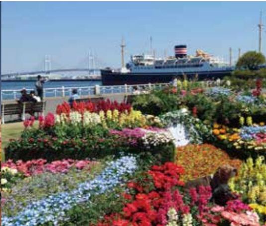
Yokohama Port/Yamashita Park