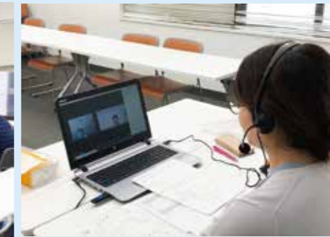
Lớp học trực tuyến

Đối tượng : Thực tập sinh kỹ năng, nhân viên công ty, người có visa gia đình, v.v.