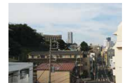
Địa danh có thể nhìn thấy từ cửa sổ