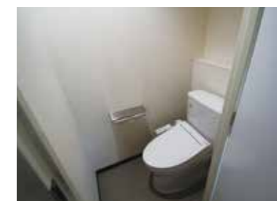
Nhà vệ sinh có bồn rửa