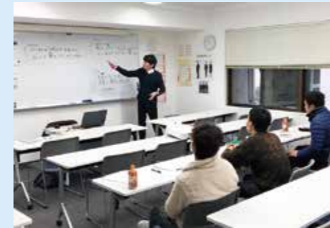
Các lớp học trực tiếp