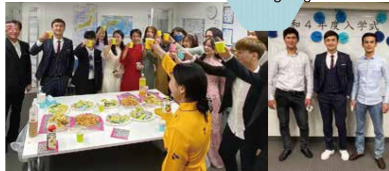
Lễ khai giảng

Ngoài các lớp học trong khuôn viên trường, còn có các chuyến đi thực tế và các sự kiện của trường. Giới thiệu các sự kiện tại trường Tokyo của chúng tôi.