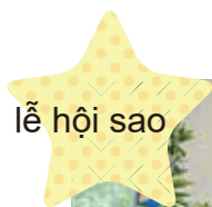
Lễ hội sao