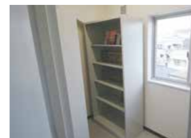
thư viện 2F