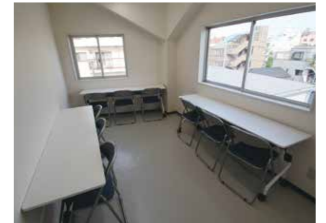
Không gian đa năng 3F