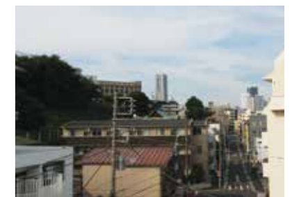
从窗户可以看到地标